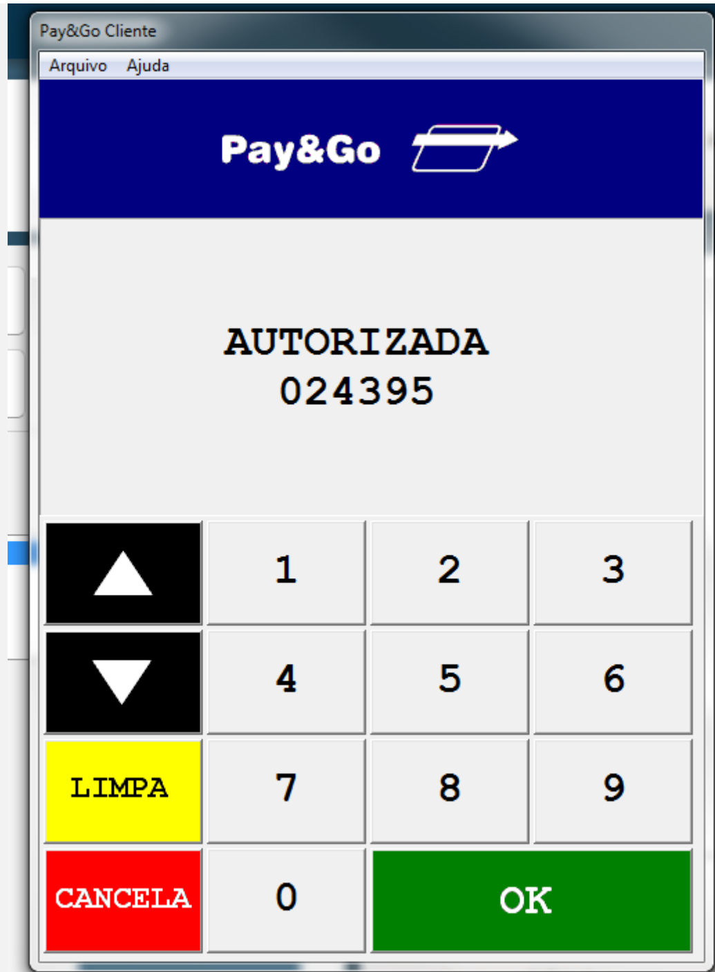
6 - Será impresso o comprovante TEF